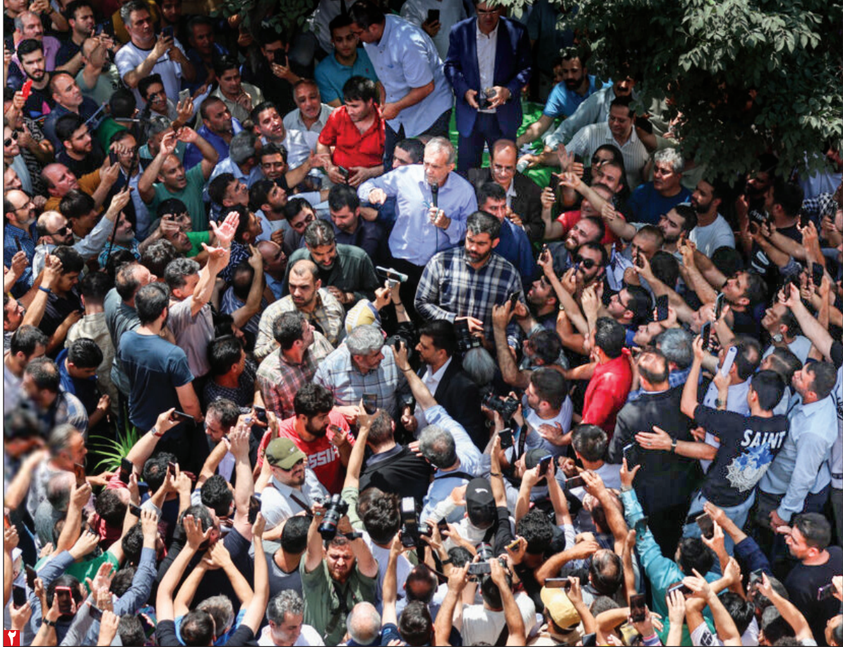
یادداشت - ۲